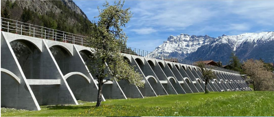
Les Marécottes: ca. 50 000 m 3